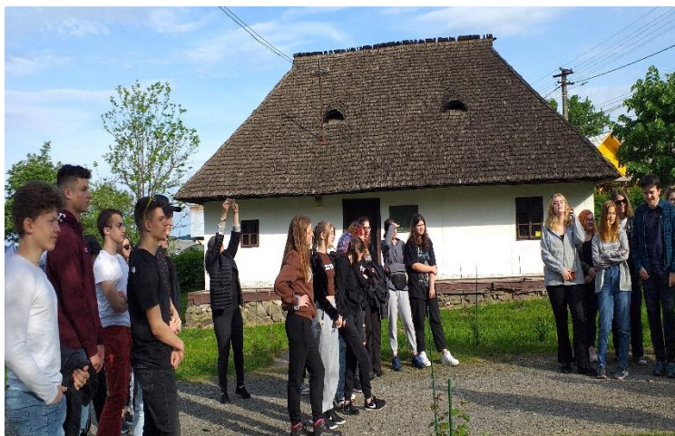
Elevii colegiului în vizită la Muzeul Memorial „Vasile Lucaciu”, Șişești

Un aspect esențial al personalității sale a fost credința profundă în rolul educației. Vasile Lucaciu considera că școala este fundamentul libertății și al progresului unui popor. El a sprijinit dezvoltarea școlilor românești și i-a încurajat pe tineri să învețe, să își cunoască rădăcinile și să își apere valorile. Activitatea ca preot și dascăl la Șişești, pe parcursul celor 30 de ani, începând cu anul 1885, a avut un impact profund asupra comunității locale. Ca preot greco-catolic, Vasile Lucaciu nu s-a limitat doar la slujirea religioasă, ci a transformat biserica într-un centru al vieții spirituale, culturale și naționale. Prin predicile sale, îi îndemna pe oameni să își păstreze credința, limba și identitatea, insuflându-le demnitate și încredere în propriile forțe. Era aproape de enoriași, le cunoștea problemele și îi sprijinea nu doar moral, ci și practic, devenind un adevărat conducător al comunității. În calitate de dascăl, Lucaciu a înțeles că educația este cea mai puternică armă împotriva ignoranței și a nedreptății.