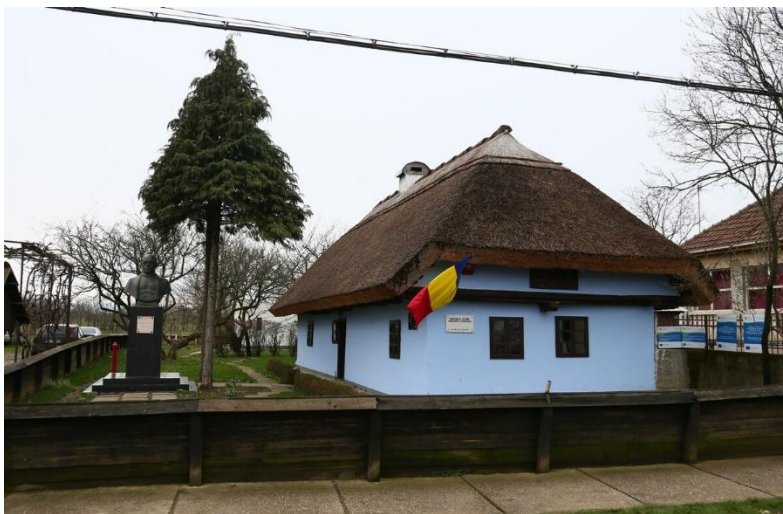
Casa Memorială Dr. Vasile Lucaciu, localitatea Apa, jud. Satu-Mare

Cunoscut sub numele de „Leul din Șișești”, Vasile Lucaciu este una dintre personalitățile marcante ale istoriei românilor din Transilvania, fiind un adevărat model de demnitate, curaj și responsabilitate civică. El rămâne până astăzi o sursă de inspirație pentru elevii Colegiului Național care îi poartă numele, fiind un mentor simbolic prin valorile pe care le-a promovat de-a lungul vieții. Născut la 21 ianuarie 1852, în localitatea Apa din comitatul Sătmar, Vasile Lucaciu a fost preot greco-catolic, om de cultură și politician. A trăit într-o perioadă dificilă pentru românii din Transilvania, când drepturile acestora erau limitate în cadrul Imperiului Austro-Ungar. În acest context, Lucaciu a înțeles că lupta pentru libertate și demnitate națională nu poate fi câștigată fără educație, unitate și curaj.