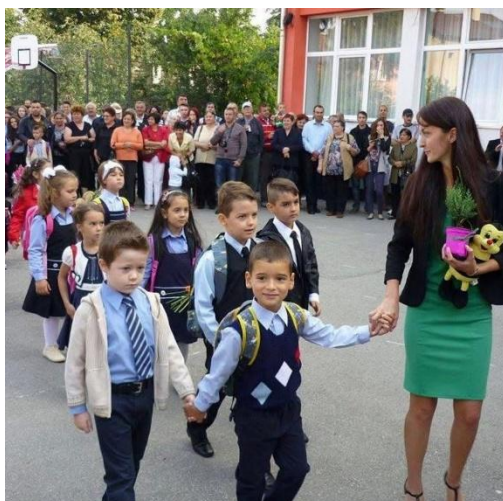
Primul meu an ca învățătoare

Îmi amintesc perfect cum îmi tremurau mâinile în timp ce scriam pe tablă primul „Bun venit!”.