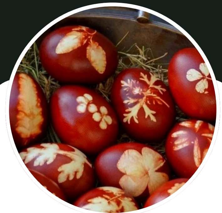
obiceiurile de Paște;

În timpul sărbătorilor, satul prinde viață prin muzică, dans și voie bună.