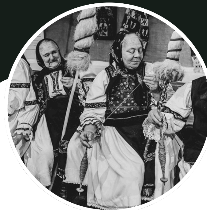
șezătorile și serile tradiționale;