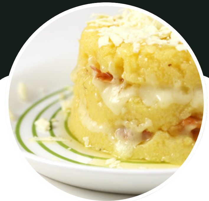
mămăliga cu brânză

Mâncarea pregătită de localnici este apreciată pentru gustul autentic și ingredientele naturale.