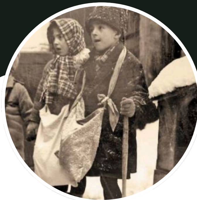
colindatul de Crăciun;

Printre cele mai importante obiceiuri se numără :