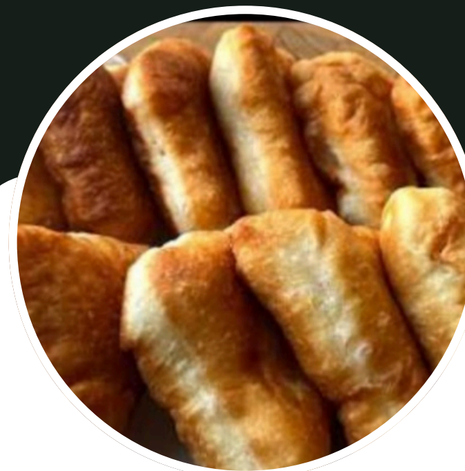
Placintele de casa