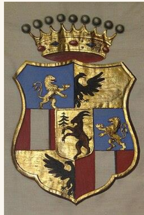
Blazonul familiei Teleki